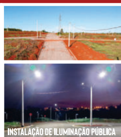
INSTALAÇÃO DE ILUMINAÇÃO PÚBLICA

ATUAMOS NA ÁREA DE ENGENHARIA ELÉTRICA E SOLAR, DESDE A ELABORAÇÃO DO SEU PROJETO ATÉ A EXECUÇÃO DA SUA OBRA.