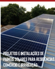
PROJETOS E INSTALAÇÕES DE PAINÉIS SOLARES PARA RESIDÊNCIAS, COMÉRCIO E IRRIGAÇÃO