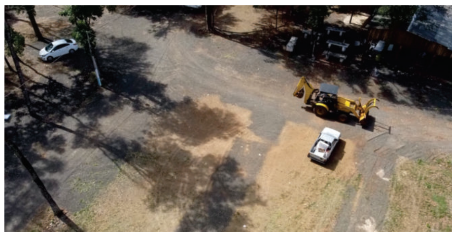
Melhorias estão sendo realizadas no Parque

doras em seus negócios, inspirando as melhores práticas no setor empresarial.