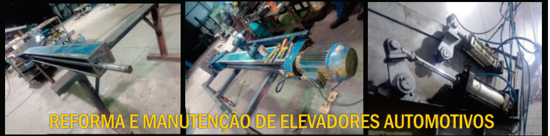
REFORMA E MANUTENÇÃO DE ELEVADORES AUTOMOTIVOS