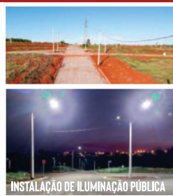
INSTALAÇÃO DE ILUMINAÇÃO PÚBLICA

ATUAMOS NA ÁREA DE ENGENHARIA ELÉTRICA E SOLAR, DESDE A ELABORAÇÃO DO SEU PROJETO ATÉ A EXECUÇÃO DA SUA OBRA.